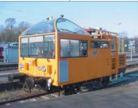
Construction et production d'une série de draine d'inspection caténaire