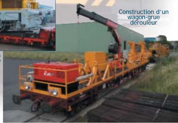
Construction d'un wagon-grue dérouleur