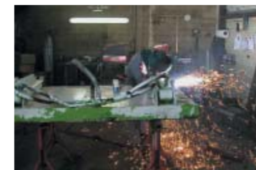
Renfort de structures matériels de voirie