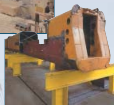
Reconstruction / redressage de flèches de grue