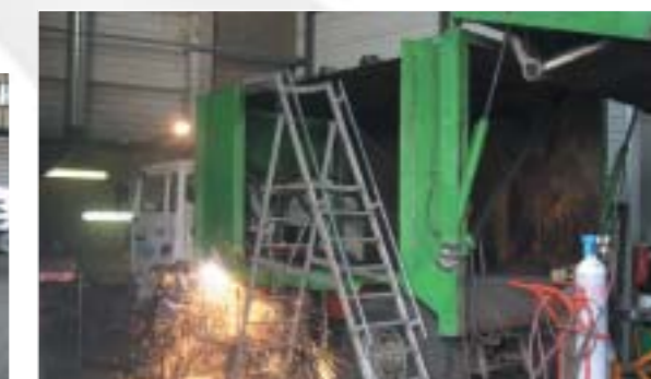
Reconstruction d'un caisson de BOM