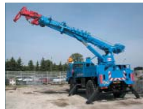
Rénovation d'une foreuse-grue sur porteur