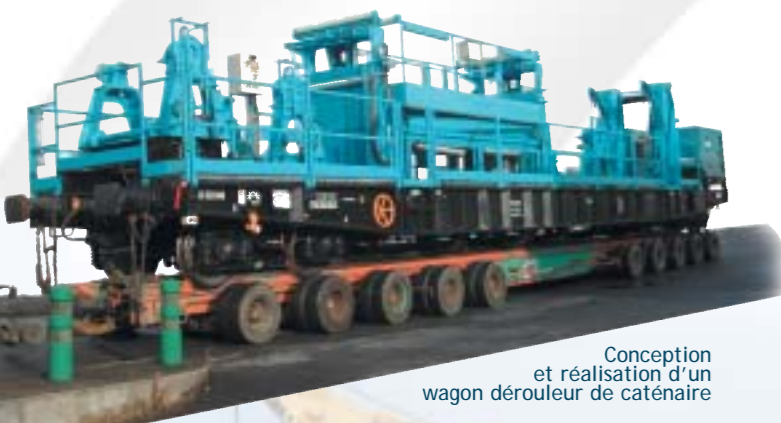
Conception et réalisation d'un wagon dérouleur de caténaire