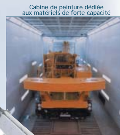
Cabine de peinture dédiée aux matériels de forte capacité