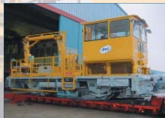
Reconstruction et mise aux normes d'engins de maintenance caténaire