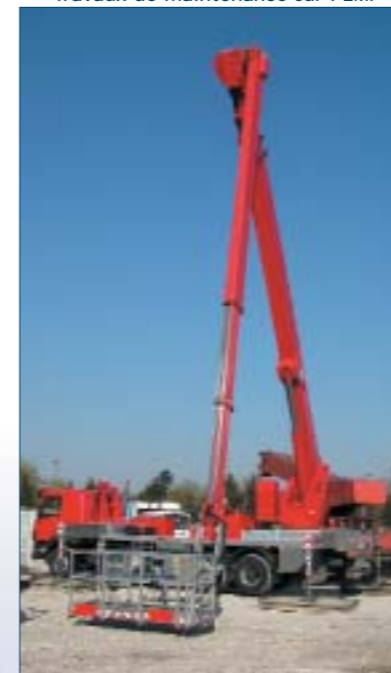
Travaux de maintenance sur PEMP

PVI intervient sur tous types d'engins de levage, d'élévation de personnels (PEMP), de travaux publics ou encore de services aéroportuaires. L'entreprise traite des réparations lourdes sur des matériels accidentés ou usagés, des travaux de rénovation, des travaux de maintenance préventive.