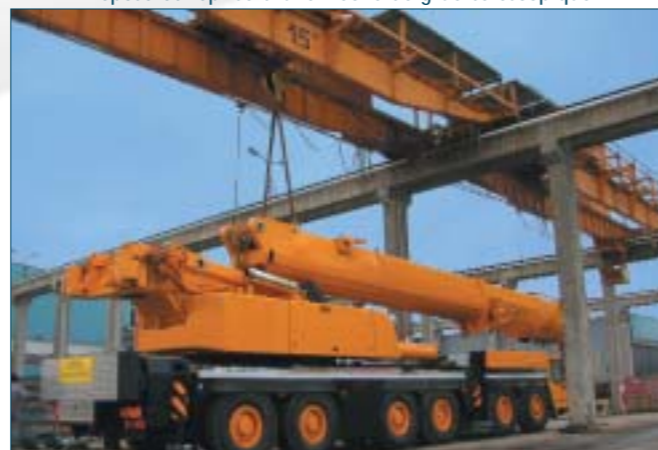
Dépose et reprise d'une flèche de grue télescopique